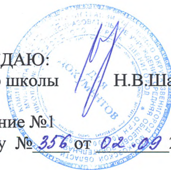
График проведения предметных недель в МОУ СОШ № 1 г.о.Звенигород в 2019-2020 учебном году (5-11 классы)

Приложение №1 к приказу № 356 от 02.09 2019г.