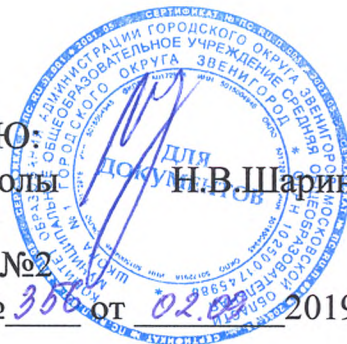
График проведения предметных недель в МОУ СОШ № 1 г.о.Звенигород в 2019-2020 учебном году (1-4 классы)

Приложение №2 к приказу № 356 от 02.08 2019г.