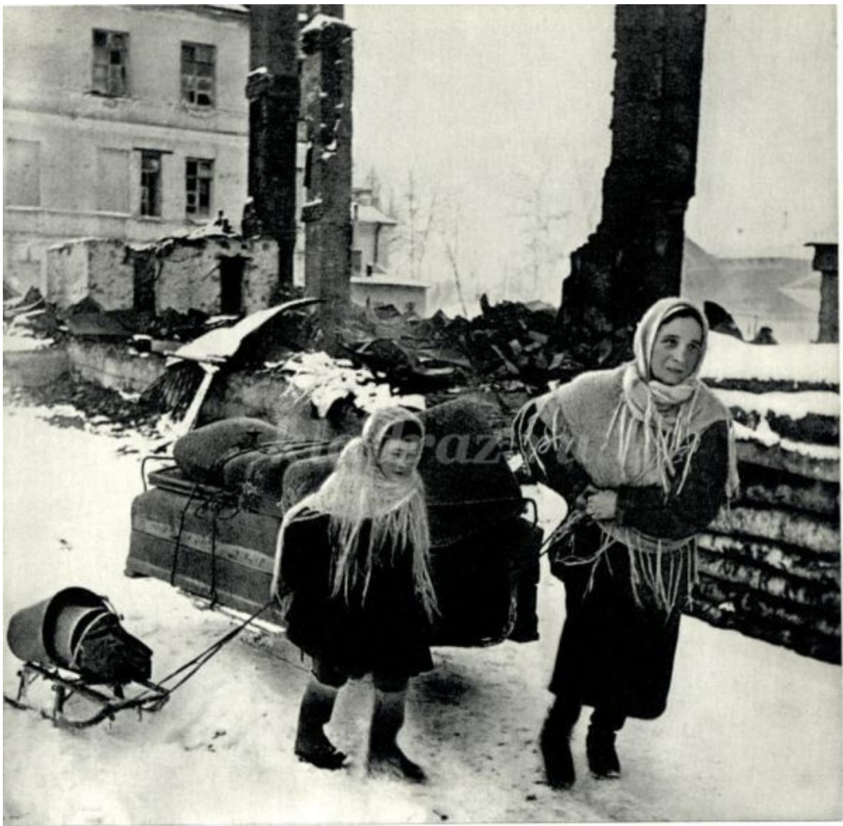
Надо искать новый кров. . .

«Под девяносто, что ни говори. И столько пережить, и столько вынести». Не поднялась рука из дома вынести Тяжелые ржаные сухари.